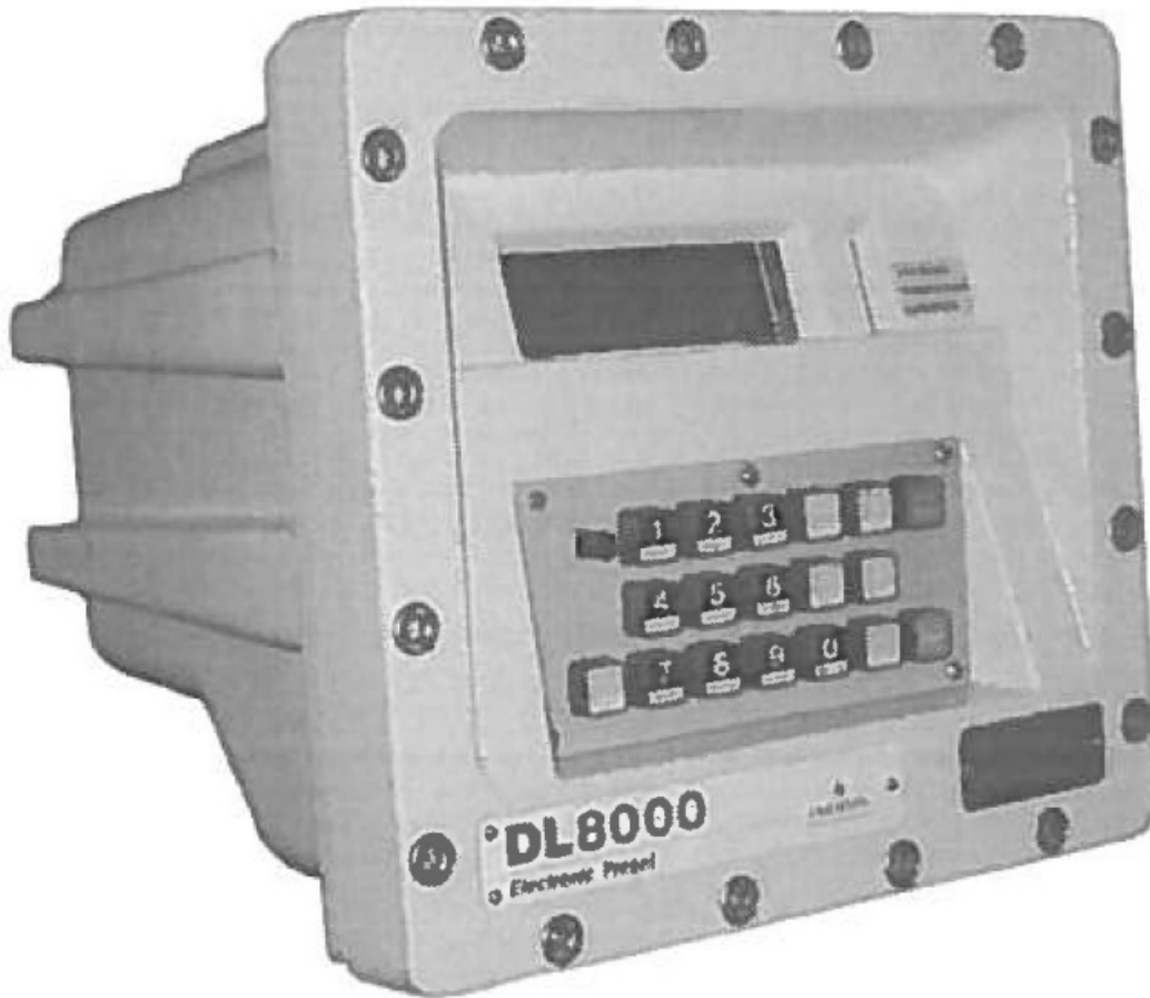
Figure 2: DL8000